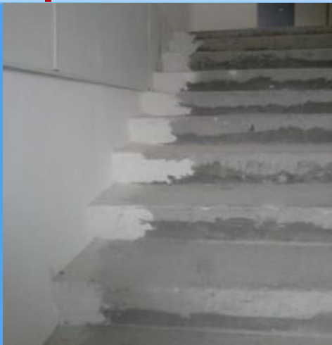
Восстановление лестничных маршей