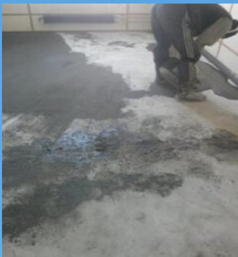
Восстановление напольных покрытий