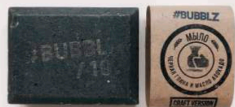
ЧЕРНАЯ ГЛИНА И МАСЛО АВОКАДО