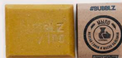
ЖЕЛТАЯ ГЛИНА И МАСЛО