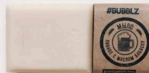
ПИВНОЕ С МАСЛОМ БАБАСУ