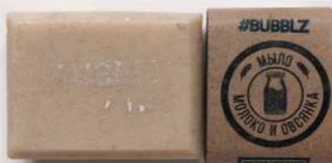
МОЛОКО И ОВСЯНКА