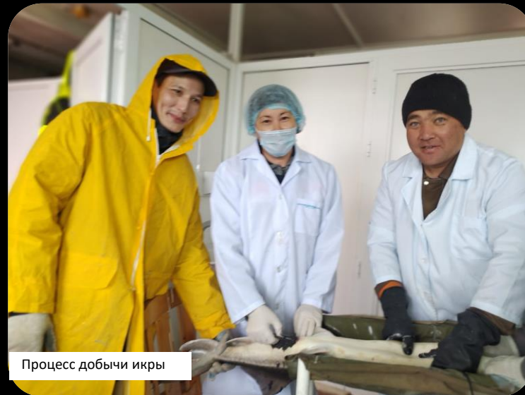
Процесс добычи икры