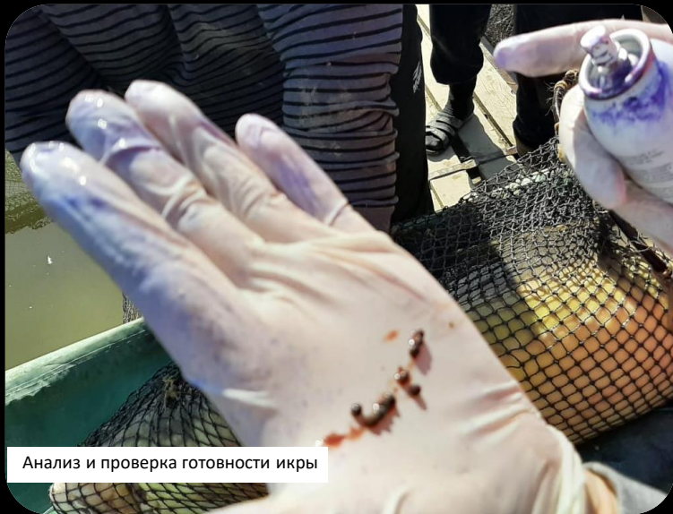
Анализ и проверка готовности икры

Наша компания сосредоточена на добыче черной икры (с соблюдением технологии добычи (дойки) и международных стандартов) с последующей реализацией на рынке Казахстана и других стран. В планах компании расширение продуктовой линейки: реализация свежего, копченого и вяленого мяса осетра и иных ценных пород рыб.