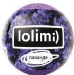
Лаванда 135гр 500тг