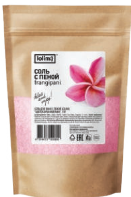
«Цветок Франжипани» 1 кг 1500тг

Соль с пеной «Цветок франжипани» - богатый минеральный состав насыщает кожу микроэлементами, помогает выводить токсины и лишнюю жидкость, способствуя похудению и оздоровлению всего тела. Драгоценный аромат экзотических цветов франжипани расслабляет, умиротворяет и оставляет на коже нежный шлейф. Чтобы восстановиться, поднять настроение и успокоиться достаточно окунуться в мир ароматов нежной, окутывающей пены.