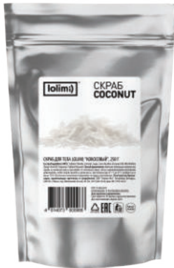
«Кокосовый» 250 г 1100тг

Скраб для тела «Кокосовый». Бережно удаляет ороговевшие частицы эпидермиса, питает на клеточном уровне, избавляет от стянутости, сухости и шелушения, защищает от признаков увядания, придает бархатистость и шелковистость, максимально увлажняет, заботится о коже, делая ее более упругой и эластичной. Кокосовая стружка массирует, усиливает кровообращение и омолаживает кожу.