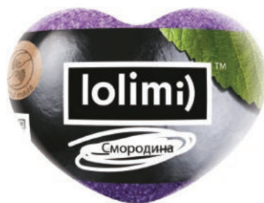
Смородина 145гр 500тг