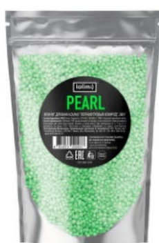
«Перламутровый Изумруд» 380 г 1300тг