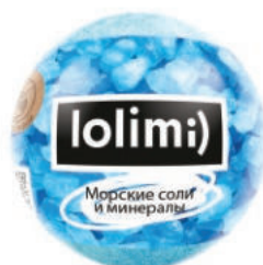
Морские соли и минералы 135гр 500тг