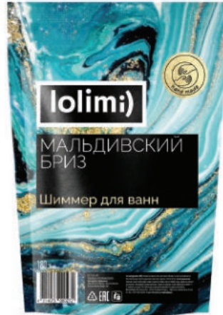
«Мальдивский бриз» 180 г 1600тг