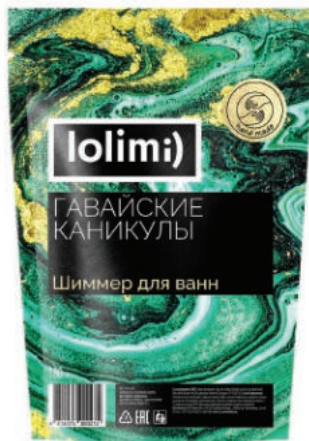
«Гавайские каникулы» 180 г 1600тг