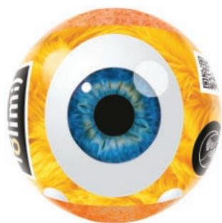
Дынька 135гр 500тг