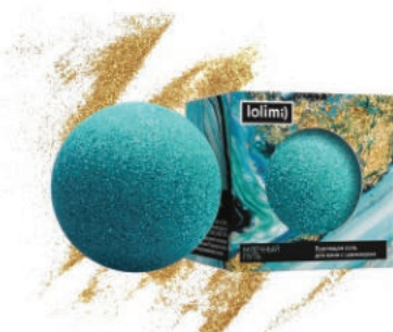
Млечный путь 135гр 650тг