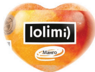
Манго 145гр 500тг