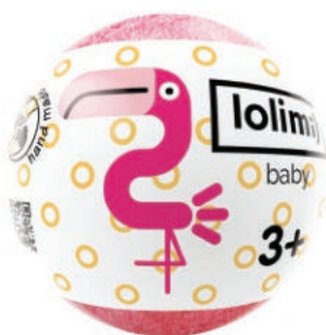
Малина 135гр 560тг