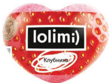
Клубника 145гр 500тг