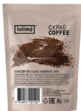
«Кофейный» 500 г 1500тг

Скраб для тела «Кокосовый». Бережно удаляет ороговевшие частицы эпидермиса, питает на клеточном уровне, избавляет от стянутости, сухости и шелушения, защищает от признаков увядания, придает бархатистость и шелковистость, максимально увлажняет, заботится о коже, делая ее более упругой и эластичной. Кокосовая стружка массирует, усиливает кровообращение и омолаживает кожу.