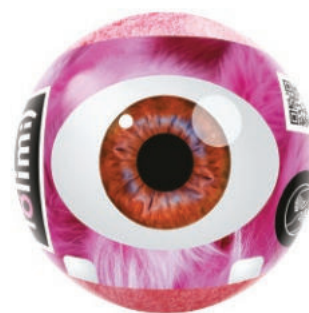
Малинка 135гр 500тг