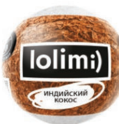
Индийский кокос 135гр 500тг