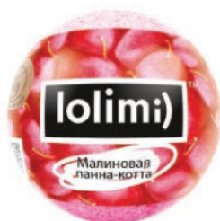
Малиновая панна-котта 135гр 500тг