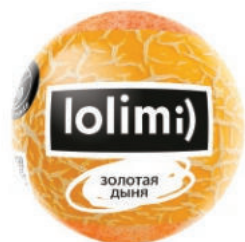
Золотая дыня 135гр 500тг