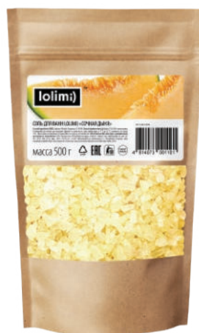
«Сочная дыня» 500 г 1100тг