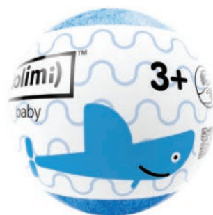
Морской 135гр 560тг