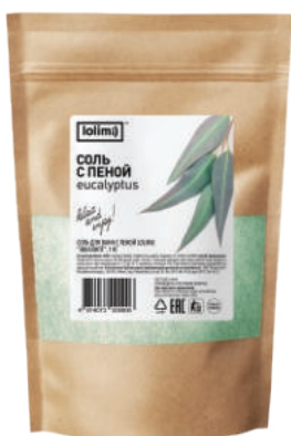
«Эвкалипт» 1 кг 1500тг

Соль с пеной «Цветок франжипани» - богатый минеральный состав насыщает кожу микроэлементами, помогает выводить токсины и лишнюю жидкость, способствуя похудению и оздоровлению всего тела. Драгоценный аромат экзотических цветов франжипани расслабляет, умиротворяет и оставляет на коже нежный шлейф. Чтобы восстановиться, поднять настроение и успокоиться достаточно окунуться в мир ароматов нежной, окутывающей пены.