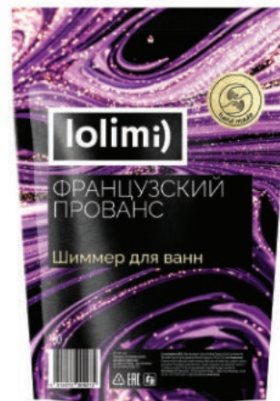
«Французский прованс» 180 г 1600тг