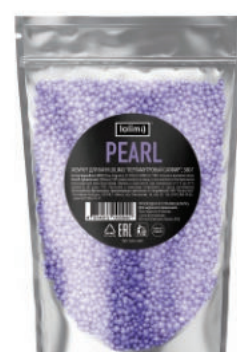
«Перламутровый Сапфир» 380 г 1300тг