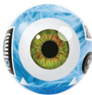
Кристалик 135гр 500тг