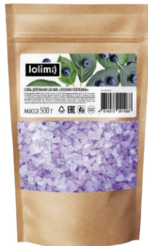
«Лесная голубика» 500 г 1100тг