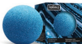
Северное сияние 135гр 650тг