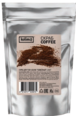
«Кофейный» 250 г 1100тг

Скраб для тела «Кокосовый». Бережно удаляет ороговевшие частицы эпидермиса, питает на клеточном уровне, избавляет от стянутости, сухости и шелушения, защищает от признаков увядания, придает бархатистость и шелковистость, максимально увлажняет, заботится о коже, делая ее более упругой и эластичной. Кокосовая стружка массирует, усиливает кровообращение и омолаживает кожу.