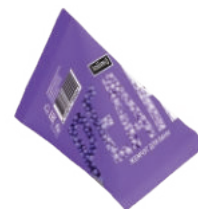
«Перламутровый Сапфир» 30 г 500тг