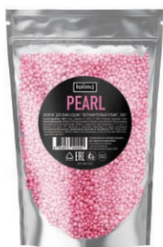
«Перламутровый Рубин» 380 г 1300тг

Представляет собой твердое соединение органических веществ, внешне похожих на кристаллики сахара. Мочевина, входящая в состав, родственная нашему организму компонент, без него не обходятся важные процессы в клетках. Обладает антисептическими (противовоспалительными), защитными, смягчающими и заживляющими свойствами. Помогает увлажнить, смягчить кожу, замедлить увядание кожи, восстановить целостность кожного покрова, улучшить цвет и микрорельеф, и защитить от воздействий окружающей среды.