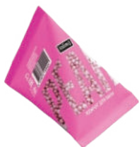
«Перламутровый Рубин» 30 г 500тг