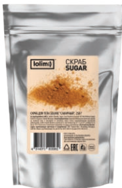
«Сахарный» 250 г 1100тг

Скраб для тела «Кофейный». Содержит натуральную морскую соль, молотый кофе, который эффективно и деликатно отшелушивает ороговевшие клетки эпидермиса, мягко очищает, тонизирует и наполняет кожу полезными микроэлементами и минералами, улучшает кровообращение и питание клеток кожи. Обладает антицеллюлитным эффектом.