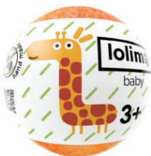
Дыня 135гр 560тг