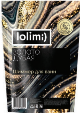
«Золото Дубая» 180 г 1600тг