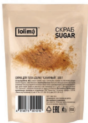
«Сахарный» 500 г 1500тг

Скраб для тела «Кофейный». Содержит натуральную морскую соль, молотый кофе, который эффективно и деликатно отшелушивает ороговевшие клетки эпидермиса, мягко очищает, тонизирует и наполняет кожу полезными микроэлементами и минералами, улучшает кровообращение и питание клеток кожи. Обладает антицеллюлитным эффектом.