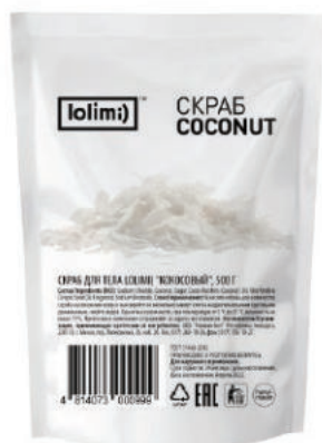
«Кокосовый» 500 г 1500тг

Скраб для тела «Кокосовый». Бережно удаляет ороговевшие частицы эпидермиса, питает на клеточном уровне, избавляет от стянутости, сухости и шелушения, защищает от признаков увядания, придает бархатистость и шелковистость, максимально увлажняет, заботится о коже, делая ее более упругой и эластичной. Кокосовая стружка массирует, усиливает кровообращение и омолаживает кожу.