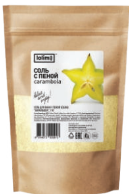
«Карамбола» 1 кг 1500тг

Соль с пеной «Эвкалипт» — усиливает кровообращение, нормализует обмен веществ, способствует регенерации клеток и омоложению организма; тонизирует, улучшает сон, избавляет от стресса, снимает мышечное напряжение. Благоприятно влияет на состояние кожи, разглаживая ее, очищая и делая более эластичной.