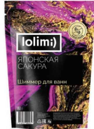
«Японская сакура» 180 г 1600тг