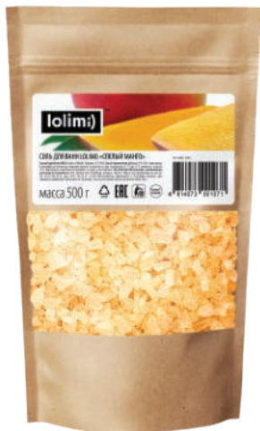
«Спелый манго» 500 г 1100тг