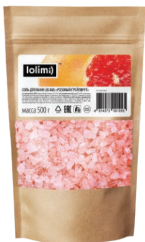
«Розовый грейпфрут» 500 г 1100тг