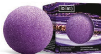
Космический фейерверк 135гр 650тг