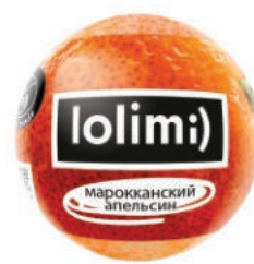
Марокканский апельсин 135гр 500тг