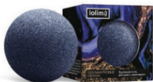
Перламутровые облака 135гр 650тг