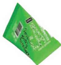
«Перламутровый Изумруд» 30 г 500тг