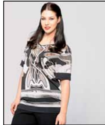
pag. 51 Maglia 91517 Pantaloni 91267