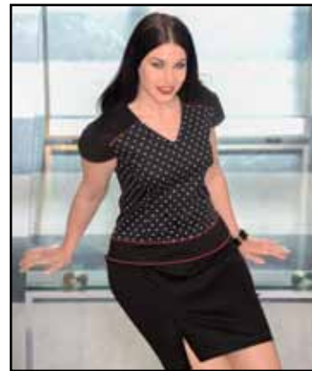
pag. 29 Abito 91520