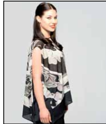
pag. 50 Caftano 91516 Pantaloni 91267