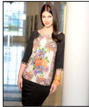
pag. 05 Abito 91274