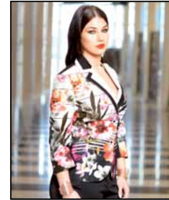
pag. 56 Giacca 91528 Pantaloni 91527