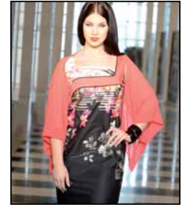
pag. 57 Coprispalle 91534 Abito 91523