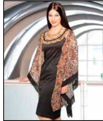
pag. 24 Abito 91263 Spolvero 91264