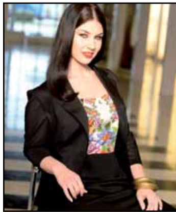
pag. 06 Giacca 91271 Abito 91277