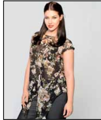
pag. 47 Blusa 91490 Pantaloni 91489