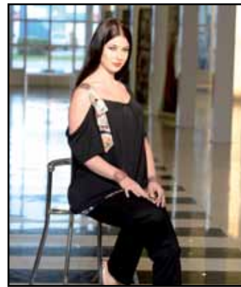
pag. 07 Maglia 91273 Pantaloni 91276