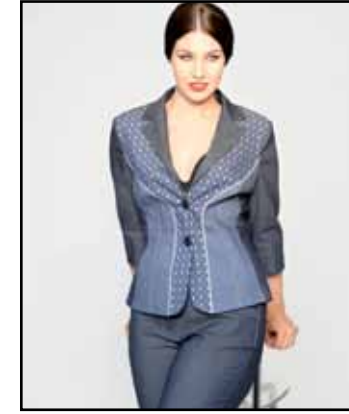
pag. 39 Giacca 91670 Pantaloni 91671