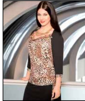
pag. 25 Abito 91266