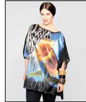
pag. 35 Maglia 91530 Leggings 91532