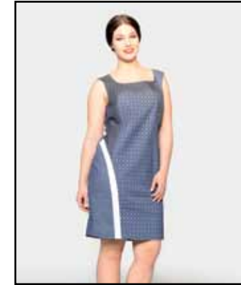
pag. 36 Abito 91488