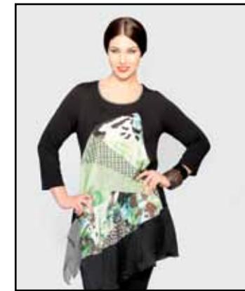
pag. 21 Maglia 91763 Leggings 91269