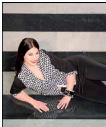
pag. 30 Giacca 91484 Pantaloni 91485