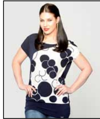
pag. 48 Maglia 91474 Jeans 91207