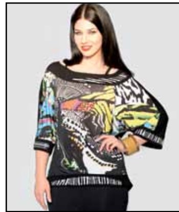
pag. 11 Maglia 91766