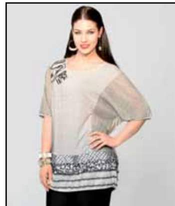
pag. 53 Maglia 91762