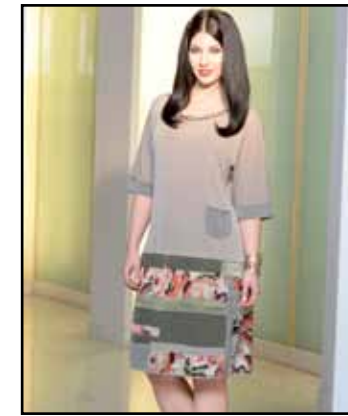
pag. 15 Abito 91772