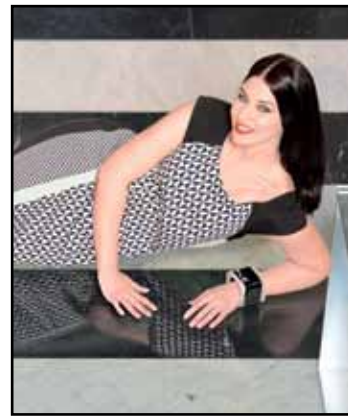
pag. 08 Abito 91487