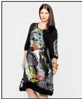
pag. 10 Abito 91767