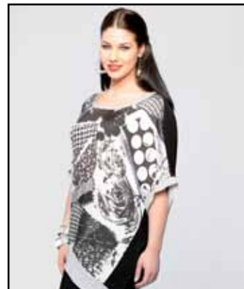
pag. 54 Maglia 91761 Pantaloni 91532