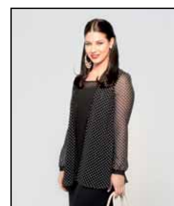
pag. 44 Twin Set 91502 Pantaloni 91381