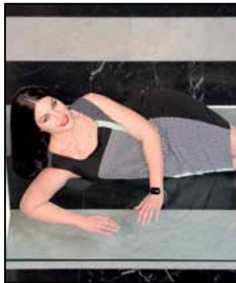
pag. 26 Abito 91483