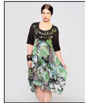
pag. 19 Abito 91765