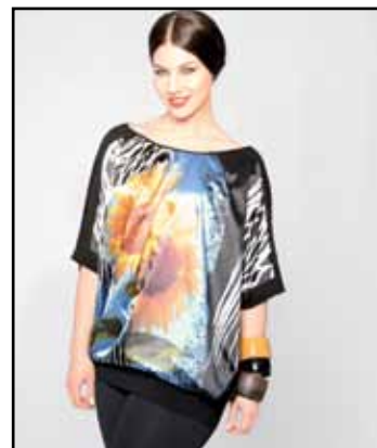
pag. 33 Maglia 91531 Leggings 91532