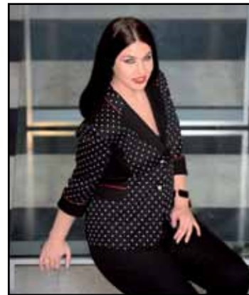
pag. 28 Giacca 91518 Pantaloni 91521