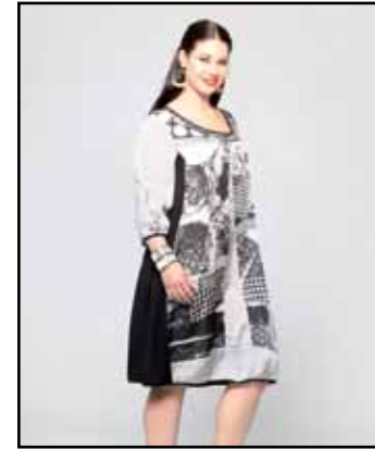
pag. 55 Abito 91759