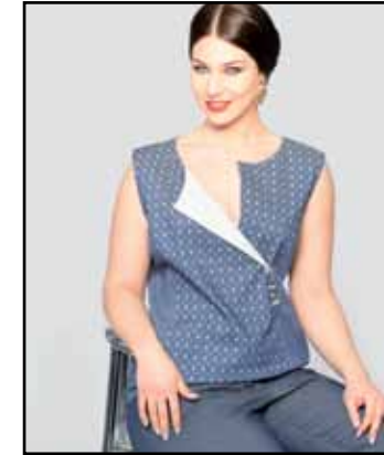
pag. 37 Corpino 91672 Pantaloni 91671