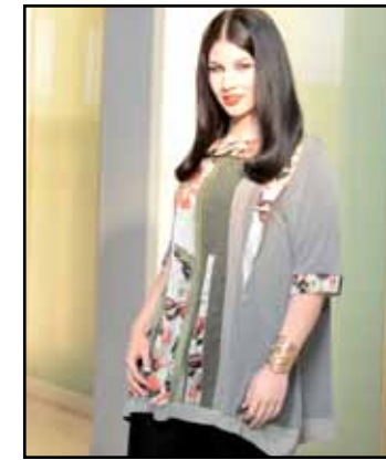
pag. 14 Maglia 91768 Leggings 91269