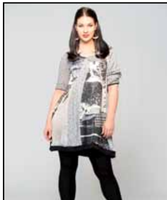
pag. 52 Maglia 91760 Pantaloni 91532