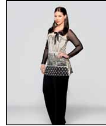
pag. 41 Maglia 91514 Pantaloni 91267