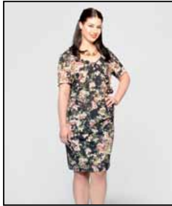
pag. 46 Abito 91491