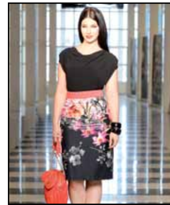
pag. 58 Abito 91524 Borsa Goffrata 91683