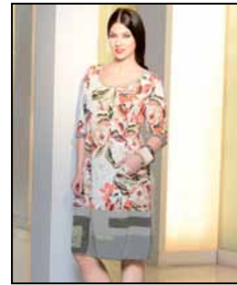
pag. 13 Abito 91771