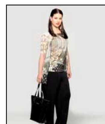
pag. 43 Twin Set 91513 Borsa Vernice 91676 Pantaloni 91267