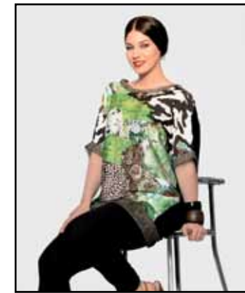
pag. 18 Maglia 91764 Leggings 91269