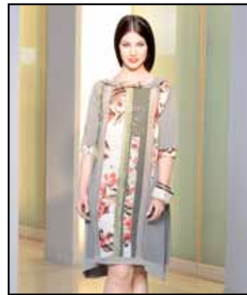
pag. 12 Abito 91769