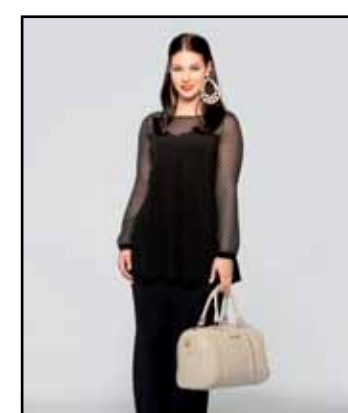
pag. 45 Maglia 91503 Pantaloni 91381 Bauletto 91674