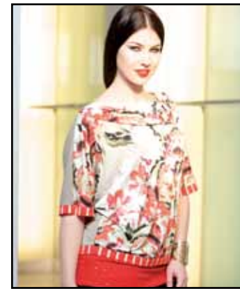
pag. 16 Maglia 91774 Pantaloni 91379