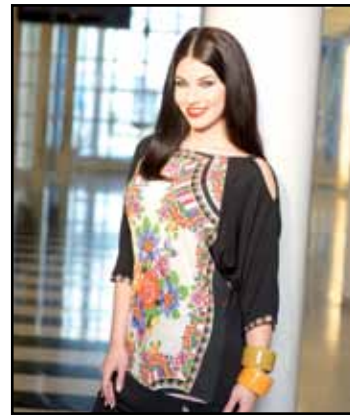
pag. 04 Maglia 91272 Leggings 91269