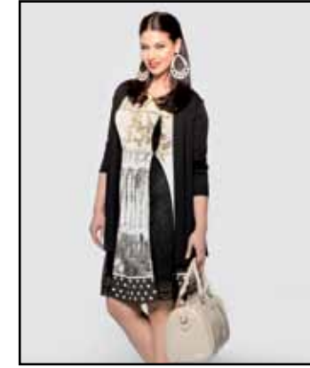
pag. 40 Abito 91515 Cardigan 91479 Bauletto 91674