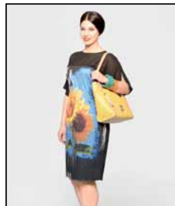
pag. 32 Abito 91529 Borsa Traforata 91677