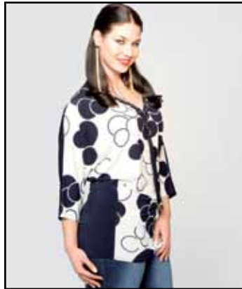
pag. 49 Maglia 91475 Jeans 91207