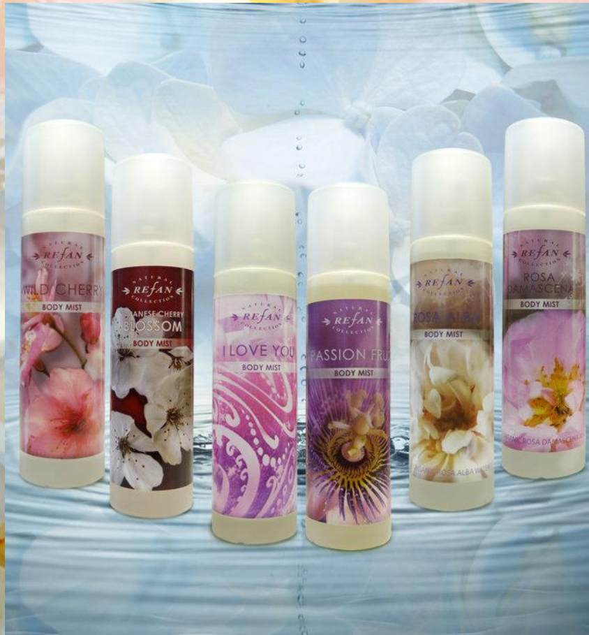
Спрей для тела

Имеет нежные ароматы. Цветочные и фруктовые нотки не оставят Вас и окружающих равнодушными. Спреи для тела Рефан подарят Вам свежесть и легкость на весь день.