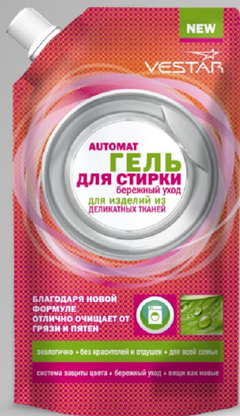
Для изделий из деликатных тканей 500 мл