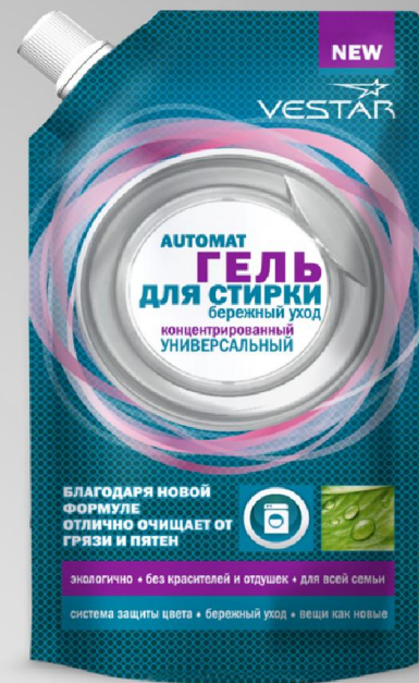
Концентрированный универсальный 500 мл

Количество в гофрокоробе: 12 Срок годности: 2 года