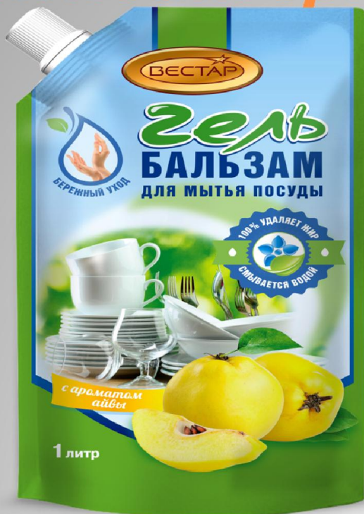
С ароматом Айвы