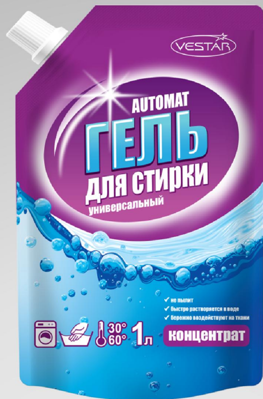
Автомат универсальный 1000 мл.