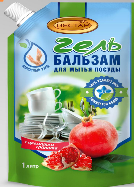
С ароматом граната