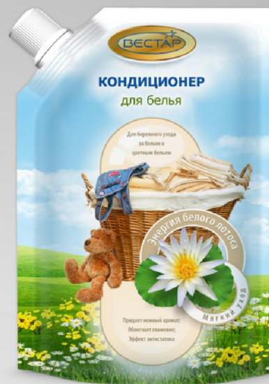
Энергия белого лотоса