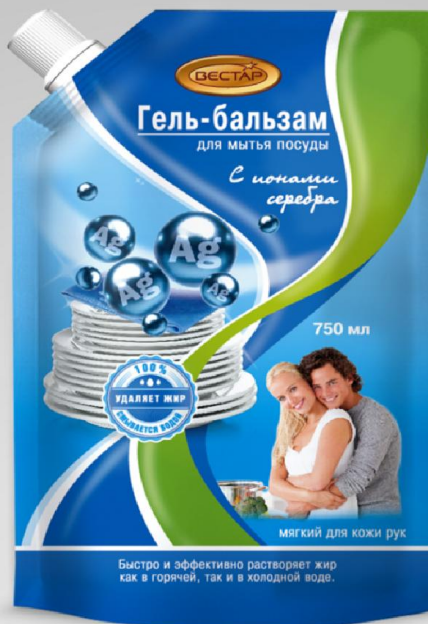
С ионами серебра